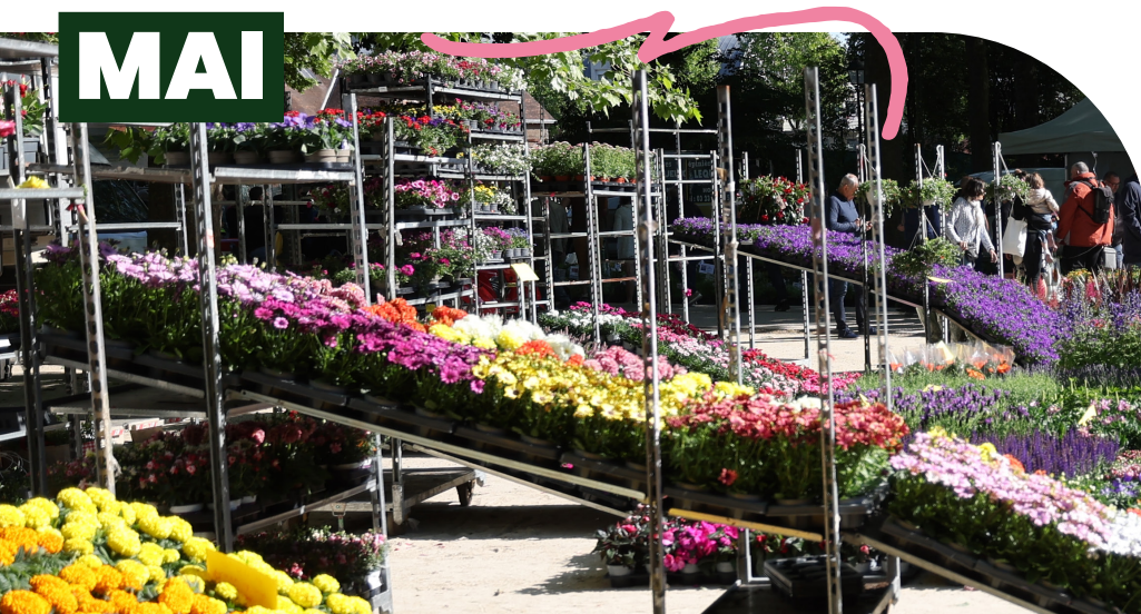
MARCHÉ AUX FLEURS