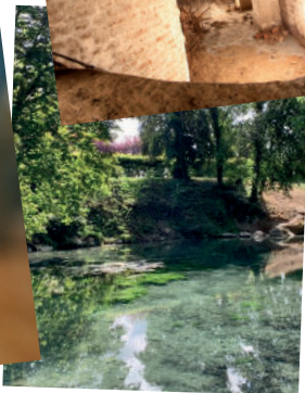
les Sources de l'Escaut