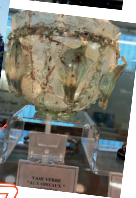
le Musée du Vermandois