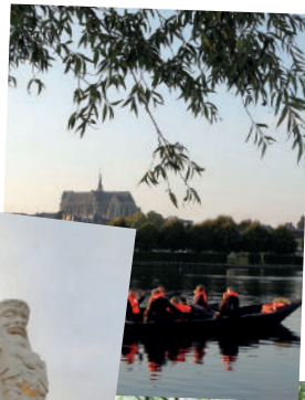
le Parc d'Isle