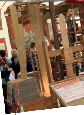
la Maison du Textile