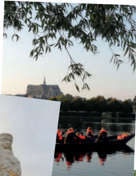
le Parc d'Isle