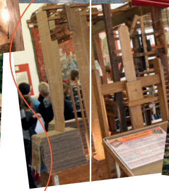
la Maison du Textile