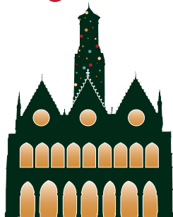
Hôtel de Ville Office de Tourisme